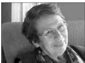
Por Eliana Segura Vega, Periodista

Los pescadores artesanales de los sindicatos de las caletas de Río Maule, Pellines, Loanco (2) Mariscadero, Pelluhue, Curanipe (2) y Cardonal que representan a más de 1200 familias dedicadas al oficio de la pesca sienten hoy que si prospera este proyecto ellos perderán su único medio de subsistencia ya que habrá una contaminación generalizada del ecosistema marítimo y además un daño irreparable en la flora y fauna terrestre que afectará la producción agrícola por la polución de cenizas que expul-