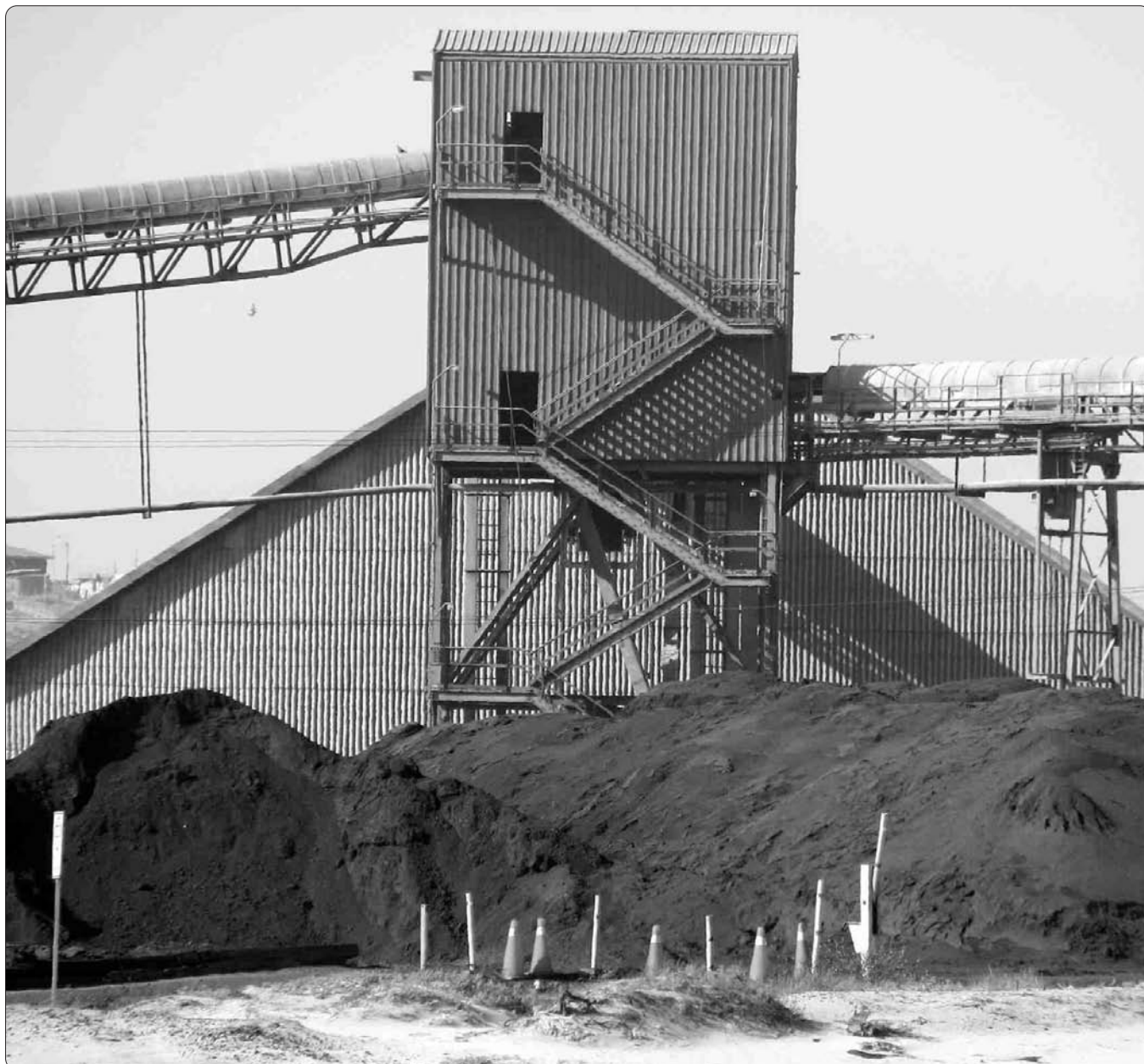
El monto total de las inversiones para desarrollar el proyecto se estima en 1300 millones de dólares.

Pero más allá de los montos involucrados, ¿conoce la ciudadanía los reales impactos de este tipo de Plantas? ¿Qué sectores se verán afectados con su construcción y posterior puesta en marcha? La presente Edición Especial de La Verdad entrega a todos sus lectores valiosos antecedentes sobre este polémico proyecto.>>